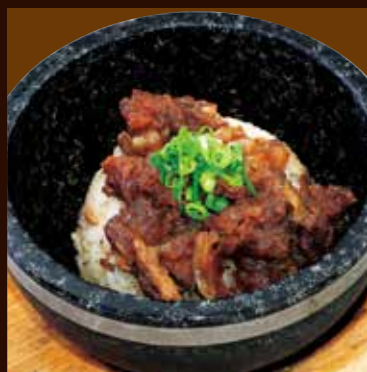
石焼牛すじガーリックライス