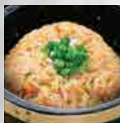
石焼ネギ チャーハン