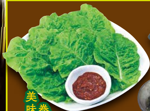
美味 巻 しいて