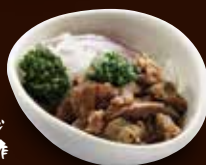
数量 限定 牛すじ ポン酢