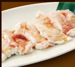
しま腸牛ホルモン