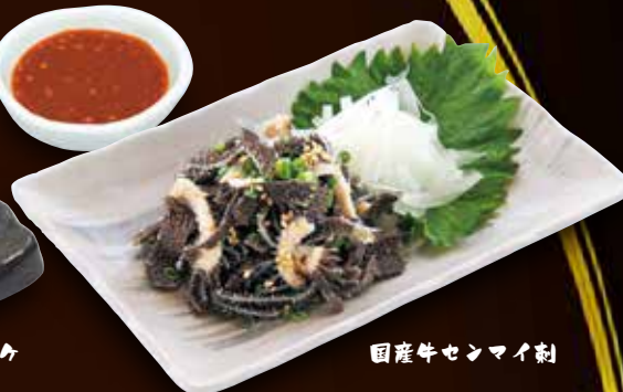
国産牛センマイ刺