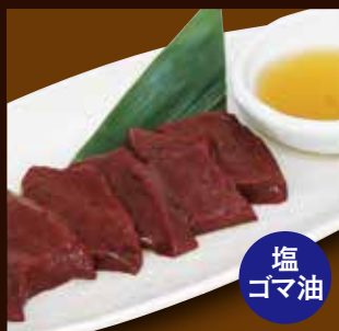
国産牛焼レバテキ