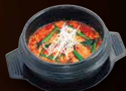
ユッケジャンスープ