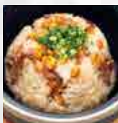
石焼ペッパー ガーリックライス