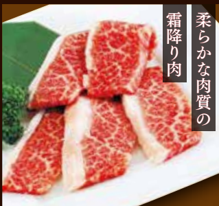
柔らかな肉質の 霜降り肉