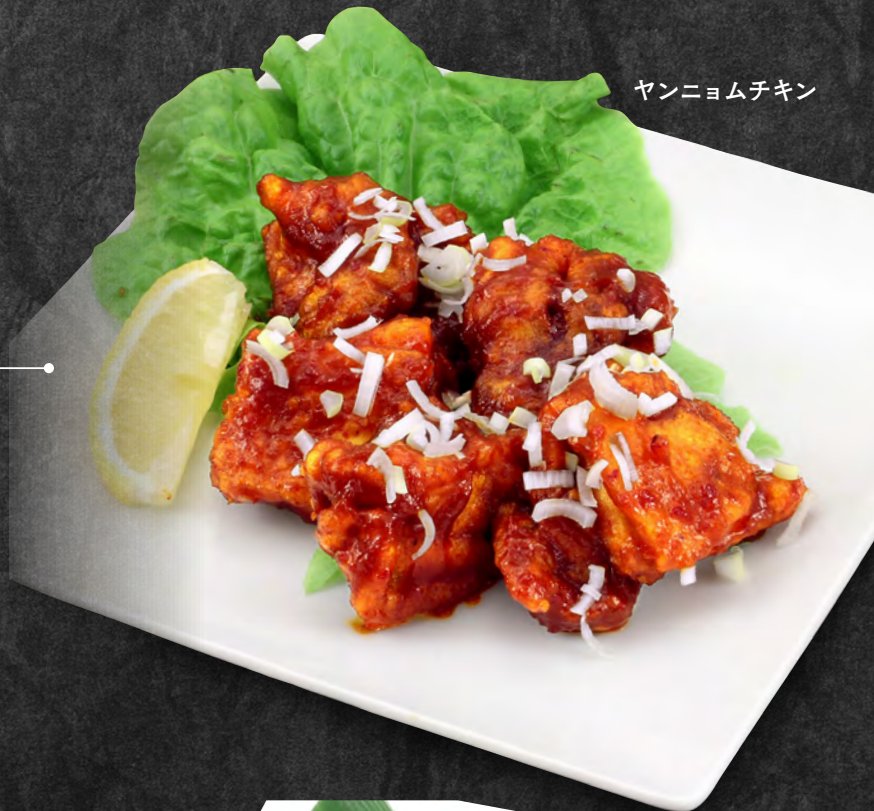
ヤンニョムチキン