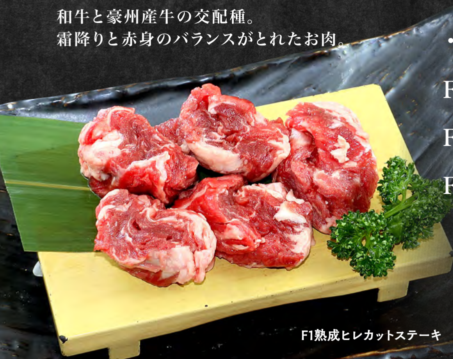
F1熟成ヒレカットステーキ