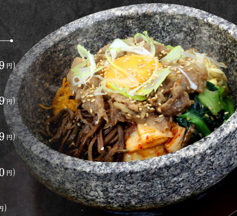
石焼牛筋ビビンバ