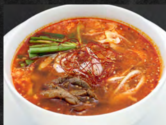
ユッケジャンスープ