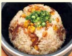
石焼ペッパー ガーリックライス