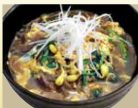
クッパ 又は ユツケジャンクッパ