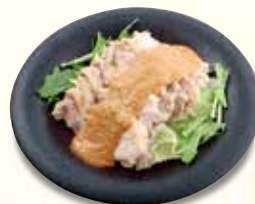
棒々鶏 バンバンチー 660 円 (税込)