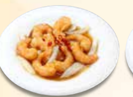
海老の辛子炒め 1,166 円 (税込)