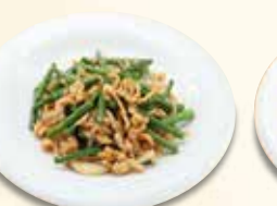
豚肉ニンニク茎炒め 1,012 円 (税込)