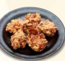
若鶏の唐揚げ 759 円 (税込)