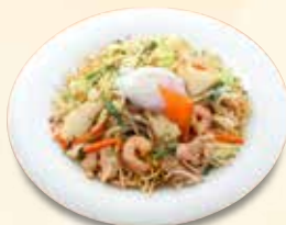
上海焼きそば 980 円 (税込)