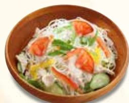
中華風サラダ 660 円 (税込)