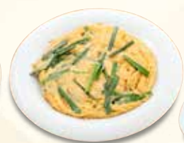
ニラ玉 770 円 (税込)