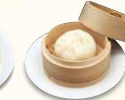
豚まん 220 円 (税込)