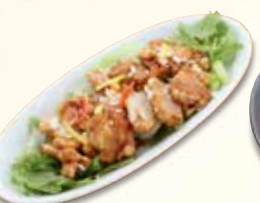
油淋鶏 858 円 (税込)