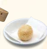
ごま団子 176 円 (税込)