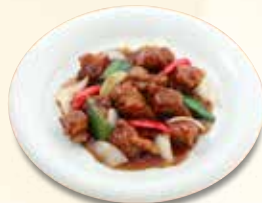
酢豚 990 円 (税込)