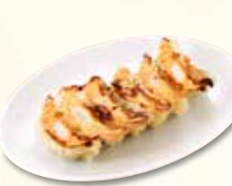
餃子 352 円 (税込)