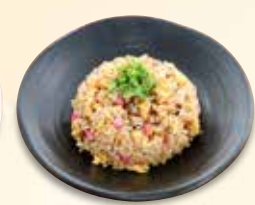
炒飯 759 円 (税込)