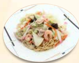
博多皿うどん 990 円 (税込)