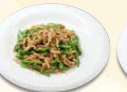
豚肉ピーマン炒め 1,012 円 (税込)