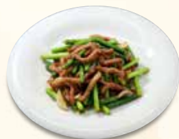
牛肉ニンニク茎炒め 1,276 円 (税込)