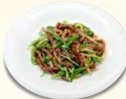
牛肉ピーマン炒め 1,276 円 (税込)