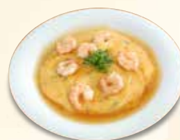
海老玉あんかけ 1,100 円 (税込)