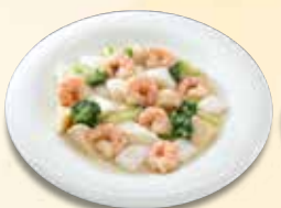
海老とイカの塩味炒め 1,254 円 (税込)