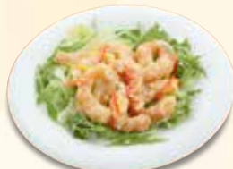
海老のマヨネーズ和え 1,342 円 (税込)