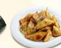
芋アメ 715 円 (税込)