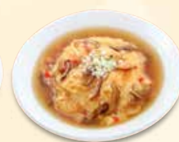
天津飯 847 円 (税込)