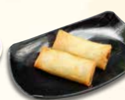
春巻き 330 円 (税込)