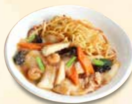
あんかけ焼きそば 990 円 (税込)