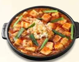
四川麻婆豆腐 858 円 (税込)