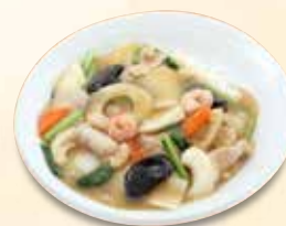
中華丼 902 円 (税込)