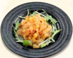
中華クラゲ 660 円 (税込)