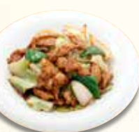
回鍋肉 990 円 (税込)