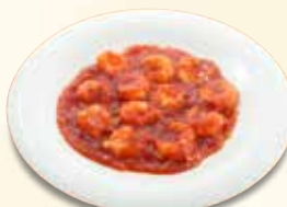
海老のチリソース 1,342 円 (税込)