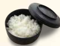
白ご飯 275 円 (税込)