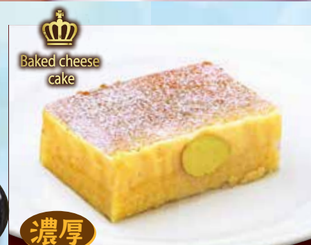
濃厚 ベイクドチーズケーキ 390円(税込429円)