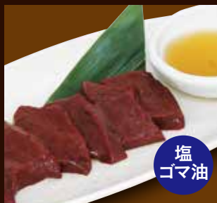
国産牛焼レバテキ