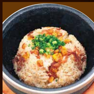
石焼ペッパーガーリックライス