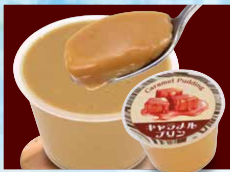
キャラメルプリン 290円(税込319円)