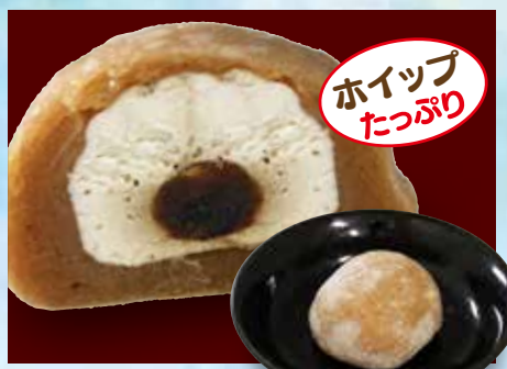
カフェオレ犬福 350円(税込385円)