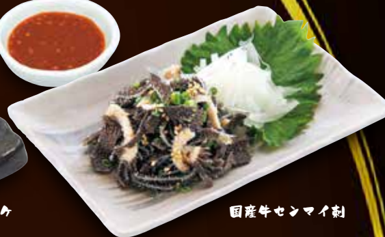
国産牛センマイ刺