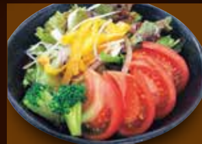
トマトイタリアンサラダ