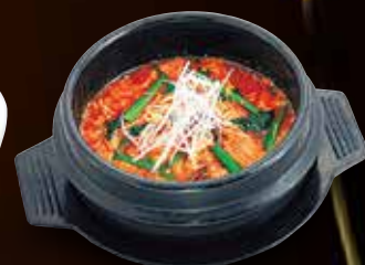
ユッケジャンスープ